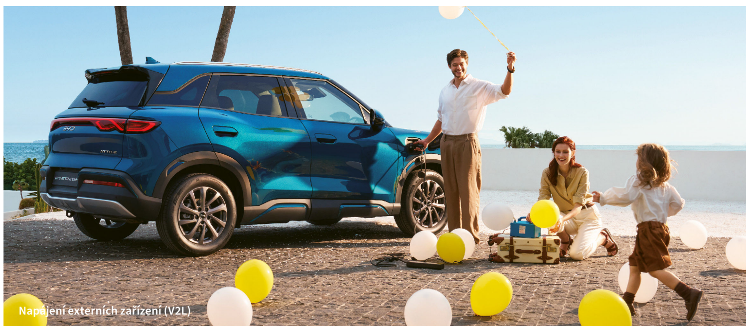
Napájení externích zařízení (V2L)