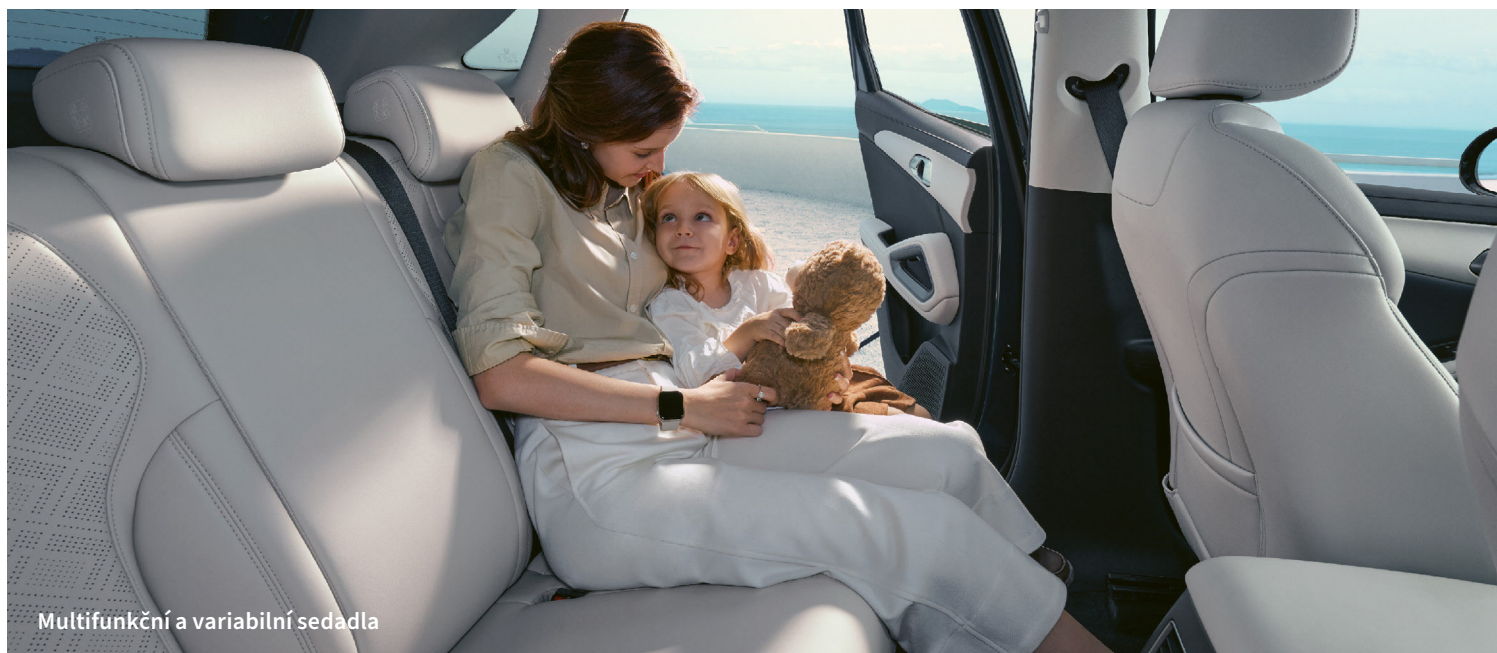
Multifunkční a variabilní sedadla