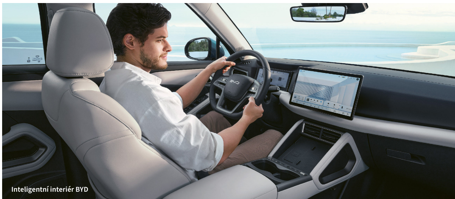
Inteligentní interiér BYD